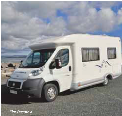
Fiat Ducato 4