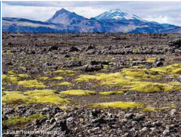
Vulkan Hekla im Hintergrund